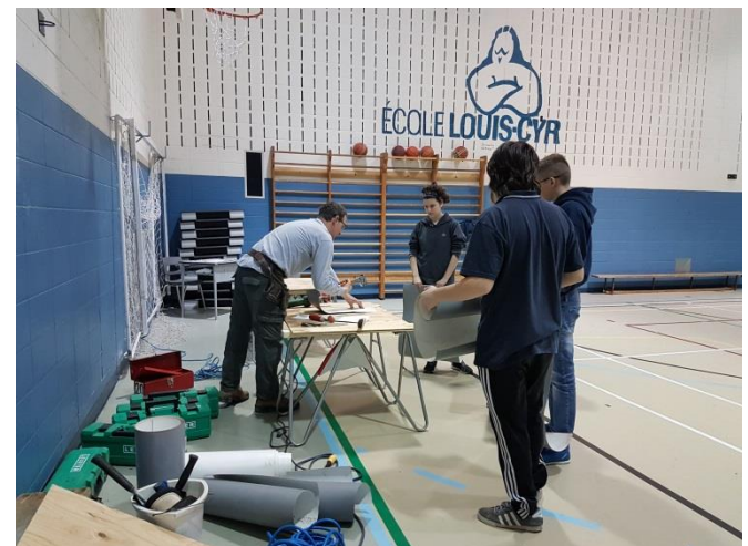
Pose de revêtement de toiture (formation offerte à l'École de formation professionnelle de Châteauguay)